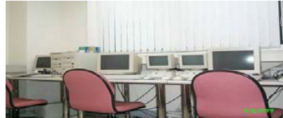
主工作室、監聽看系統