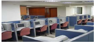
30 線電腦化訪員工作站

本所課程請上網查閱 http://www.ntnu.edu.tw/mcon/home.html